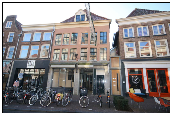
(huidige entree Oude Vismarkt)