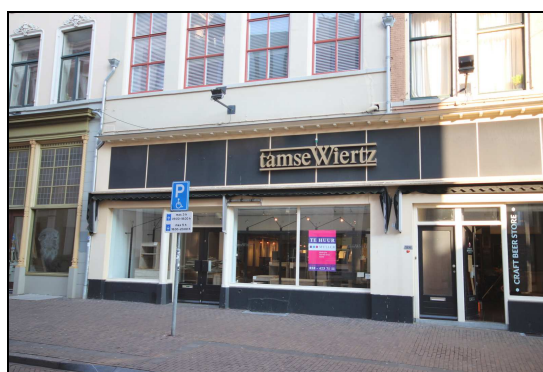
(huidige entree Sassenstraat)