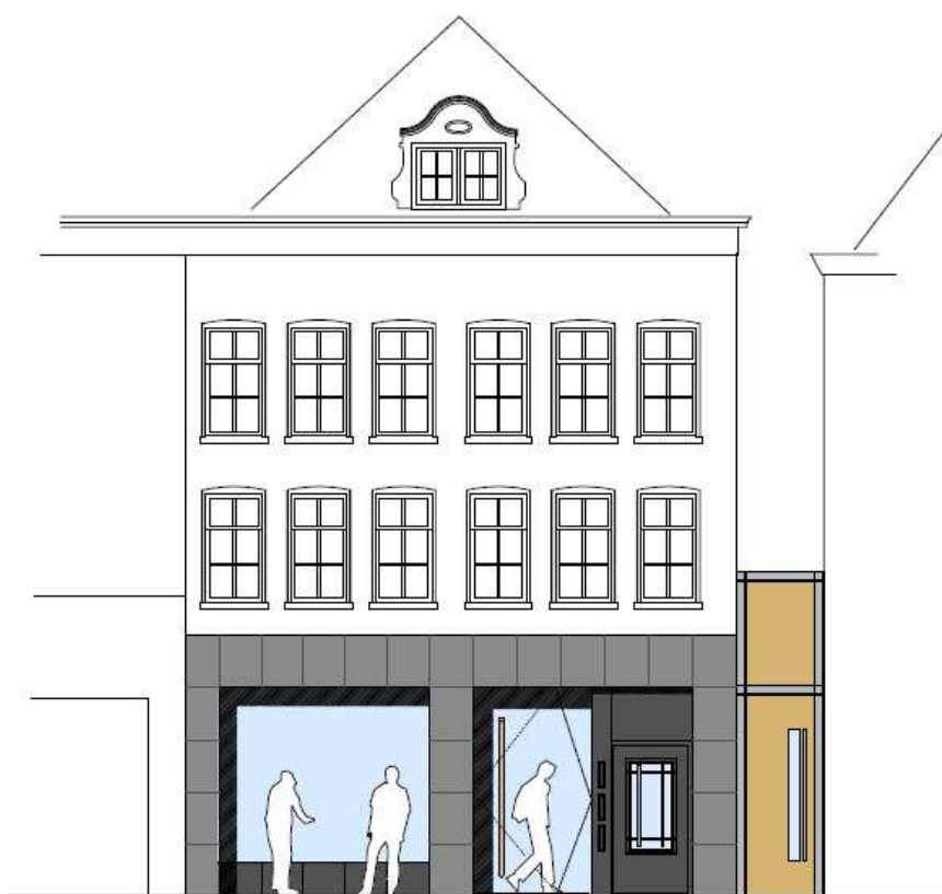
gevel oude vismarkt